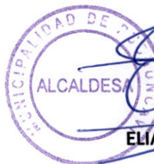
ELIANA OLMOS SOLÍS ALCALDESA