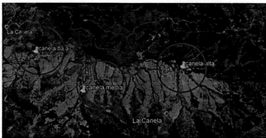
Fig. 2 Sitios de interés, para realizar la toma de puntos geofísicos.

A continuación, en la siguiente imagen se señala cada sector de interés: