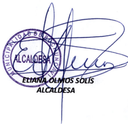
ELIANA OLMOS SOLÍS ALCALDESA