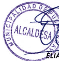
ELIANA OLMOS SOLIS ALCALDESA