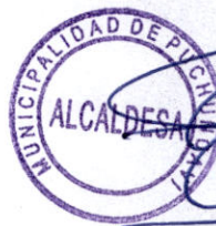
ELIANA OLMOS SOLÍS ALCALDESA